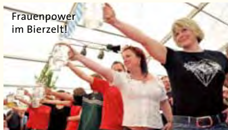
Frauenpower im Bierzelt!

Happy Hour täglich ab 22:00 Uhr alle Cocktails 4,50€