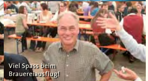
Viel Spass beim Brauereiausflug!