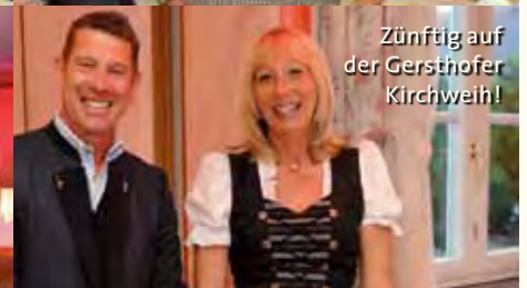
Zünftig auf der Gersthofer Kirchweih!