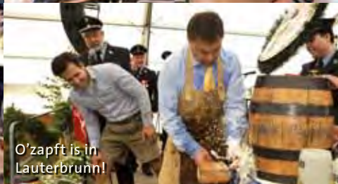
O'zapft is in Lauterbrunn!