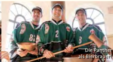
Die Panther als Bierbrauer!