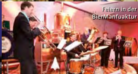
Feiern in der BierManufaktur