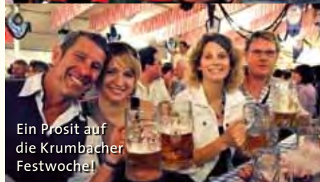
Ein Prost auf die Krumbacher Festwoche!