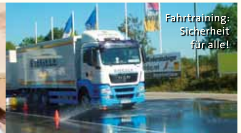
Fahrtraining: Sicherheit für alle!