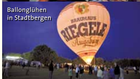
Ballonglügen in Stadtbergen